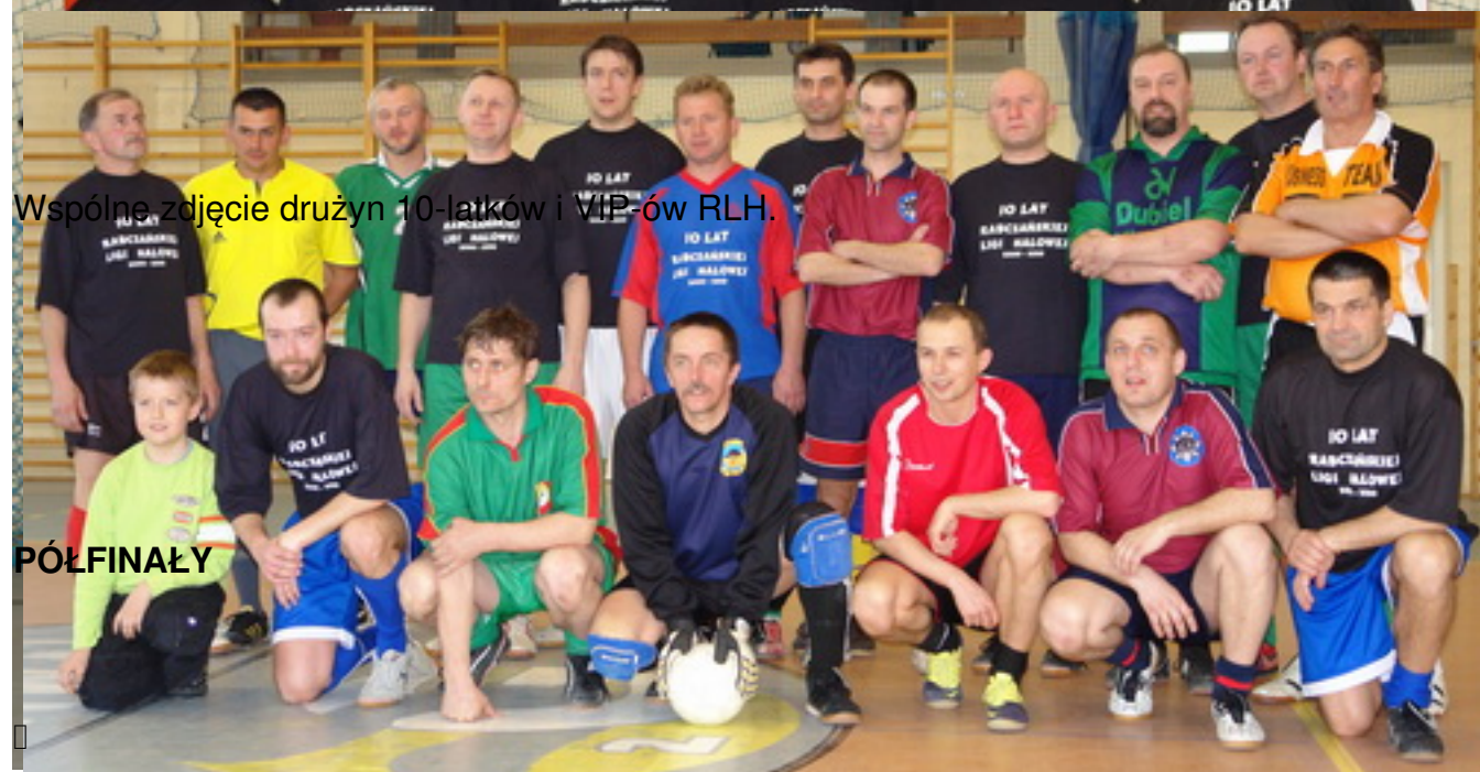
Wspólne zdjęcie drużyn 10-latków i VIP-ów RLH.